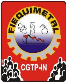
TABELA SALARIAL 2016 EDP Comunicado n.º 13