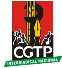
Tabela salarial fecha em 1,3% — acordo será aplicado retroativamente a janeiro.

Depois de várias reuniões desperdiçadas, sobretudo pelo comportamento pouco ortodoxo da Empresa, a Fiequimetal contribuiu de forma importante para alcançar um desfecho favorável no atual contexto , e que nos mereceu um acordo de princípio, garantindo respeito pelo compromisso assumido, desde sempre, com os trabalhadores que representa.